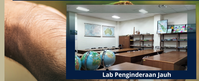
Lab Penginderaan Jauh