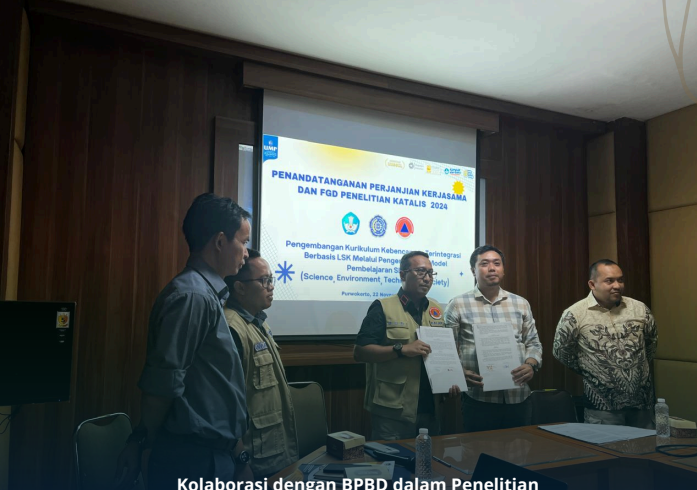
Kolaborasi dengan BPBD dalam Penelitian