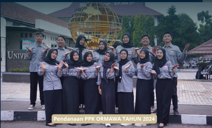
Pendanaan PPK ORMAWA TAHUN 2024